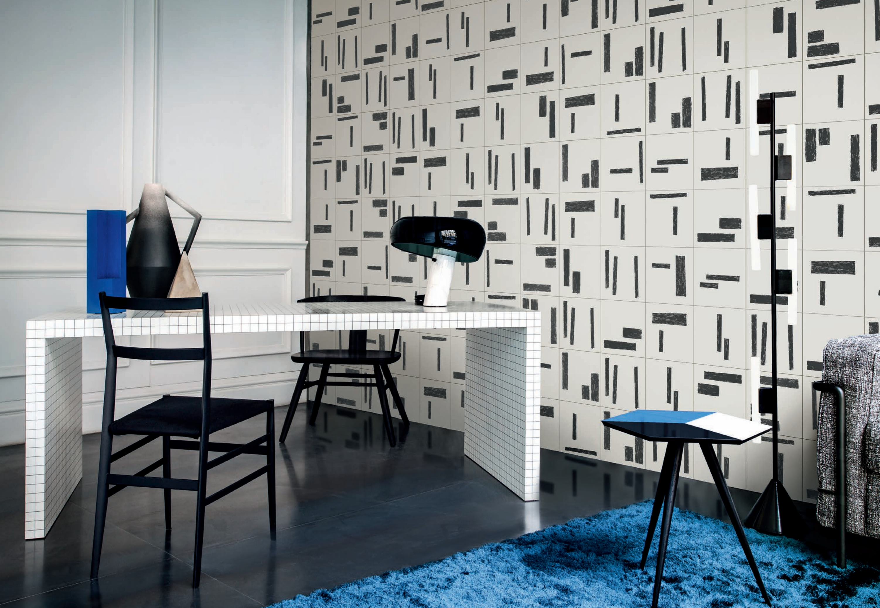
LIVING, rivestimento / covering PRIMITIVA 1 (cm. 25x25 - 10"x10")